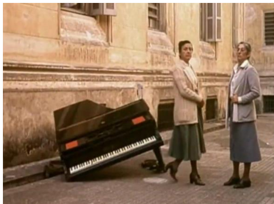
Frame de Das Tripas Coração (1982)

Um dos primeiros acontecimentos caóticos e repletos de alegorias sexuais no enredo é a tentativa de se transportar um piano para dentro da escola. Os carregadores tentam efetuar a entrada por uma janela, mas acabam rompendo o vidro e o piano termina no chão do pátio. Uma das reações vem da professora Renata (interpretada por Dina Sfat), que comenta: “eu não sei como enfia uma coisa dessas dentro dum colégio”.