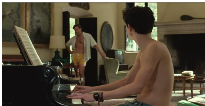
Frame de Call Me By Your Name (2017)

Oliver é esse estrangeiro (e o outro da narrativa) que surge na trama e desestabiliza a organização interna de Elio, tornando-se objeto-alvo de seu desejo e desencadeando um rearranjo de sua própria sexualidade (por trazer à consciência pulsões que vinham sendo sublimadas e recalcadas).