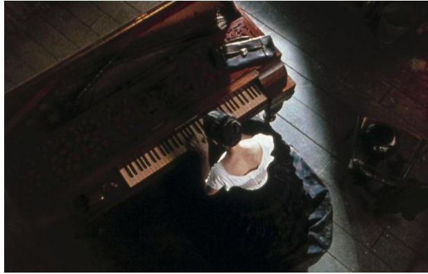
Frame de The Piano (1993)

O próprio mutismo de Ada parece um elemento metafórico na construção dessa personagem que não tem voz no seu próprio corpo, nem sobre ele — o que vai ser explorado pelo filme na dinâmica do casamento arranjado (com Stewart, um colono britânico que compra e explora terras do povo Maori) e na relação ambivalente que a protagonista desenvolve com Baines, um ex-marinheiro que vive naquele território junto aos Maori. Logo após o desembarque de Ada e Flora na praia, Stewart a fez abandonar o piano que havia trazido da longa viagem, alegando que o seu transporte não valeria o sacrifício. Interessado em Ada, Baines se propõe a buscar o piano e deixá-la tocar (e eventualmente tê-lo de volta) em troca de aulas. O piano foi trazido e mantido na casa de Baines, que recusou as aulas e condicionou a devolução do instrumento a uma submissão às suas aproximações íntimas e sexuais.