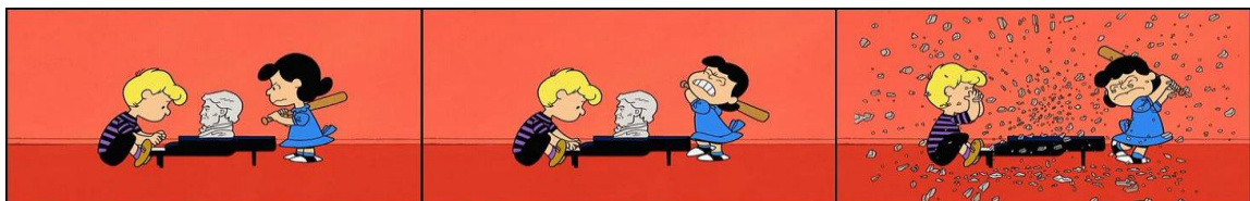
Frame de Happiness Is a Warm Blanket, Charlie Brown (2011)

A dinâmica desse par histérico-obsessivo — sempre separado pela distância (física e emocional) de um piano — é muito explorada pelos quadrinhos e animações de Peanuts , levando tanto a insights interessantes quanto a inflexões cômicas, como na tirinha onde a música se materializa numa partitura que ela usa para agredir o amigo ou na cena clássica em que a tensão é elevada ao limite e Lucy destrói o busto de Beethoven com um taco de beisebol.